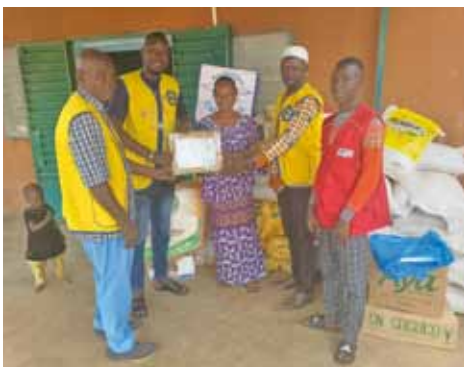
Consegna di viveri all'orfanotrofo Anadji.