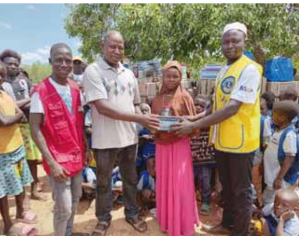
Une vue d'image d'une remise symbolique des kits scolaires.