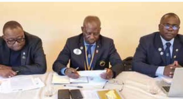
La delegazione del Distretto del Burkina.

di completamento delle strutture del campus, che sorge a 35 km dalla capitale Ouagadougou e accoglie già 30.000 studenti, provenienti in gran parte dalle zone rurali interne del paese: il progetto mira a realizzare in prossimità dell'edificio adibito a mensa universitaria una grande area agroecologica di circa 6 ettari, la cui implementazione è stata presa in carico dai Lions del Burkina Faso.