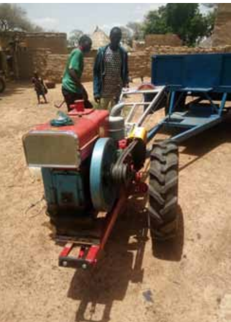
Une vue d'image du motoculteur.

Dans le but d'augmenter la capacité de production des coopératives du réseau COCOPRUDE, un tracteur a été mis leur disposition en mars dernier. La remise officielle du tracteur et de la charrette a connu la participation des membres de MK ONLUS et les LIONS du Burkina sous la présence des bénéficiaires mais également le représentant du ministère de l'agriculture.