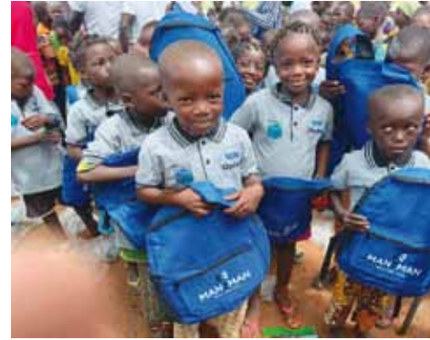
Les élèves de l'école villy se réjouissent pour les kits offerts.

Le projet « 100% à l'école » est pleine progression constante d'année en année. De l'école de Lallé Yactenga à l'école de Gounda en passant par Yili traversant Soum-Gogo à l'école de Lounga et Villy Yalgtinga en destination à l'école de Kindi plus deux mille cinq cent (2500) élèves ont octroyé des kits scolaires en cette année 2024 . Les enfants préscolaires de Tondogosso ont bénéficié de manuels et les élèves de second niveau de Ziniaré ont par ailleurs été également doté en kits scolaires en 2024. La mobilisation pour cette Kits scolaires a eu une valeur totale de onze (11) millions CFA . Ces kits ont permis aux élèves de poursuivre leur étude avec quiétude. Les kits scolaires sont composés de tee-shirts, de sacs, de cahiers, de stylos, de crayons, de gommes, de taille-crayons, de lampes solaires . En rappel, le lancement de la cérémonie officielle s'est tenue à Ziniaré dans la province Oubritenga le 30 Octobre 2024. Cette cérémonie a connu la présence du Gouverneur du district 403A3 Jean Urbain KORSAGA, le représentant de MK LAB du Burkina Evariste ZOUNGRANA, les autorités coutumières et administratives, les autorités militaires et paramilitaires ainsi que les lions du Burkina et les membres bénévoles de l'association ASDE sous la présence des bénéficiaires. Ce projet devra s'étendre dans les années à venir au Burkina Faso.