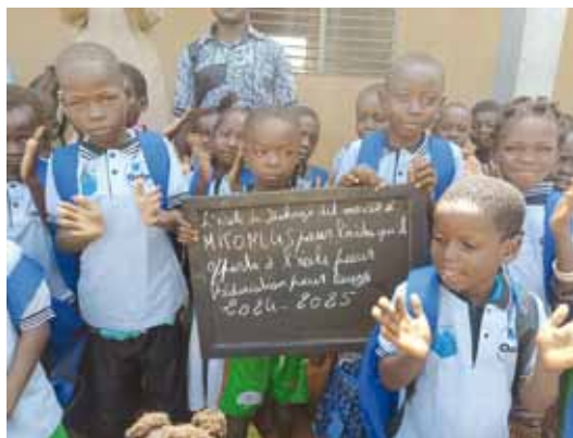
Gli alunni della scuola di Dakaye felici per il materiale ricevuto.

Il 7 novembre è stata organizzata una manifestazione che ha ufficializzato l'importante service anche attraverso i media. L'aiuto alla partecipazione scolastica è un tema molto sentito ed apprezzato nel Paese.