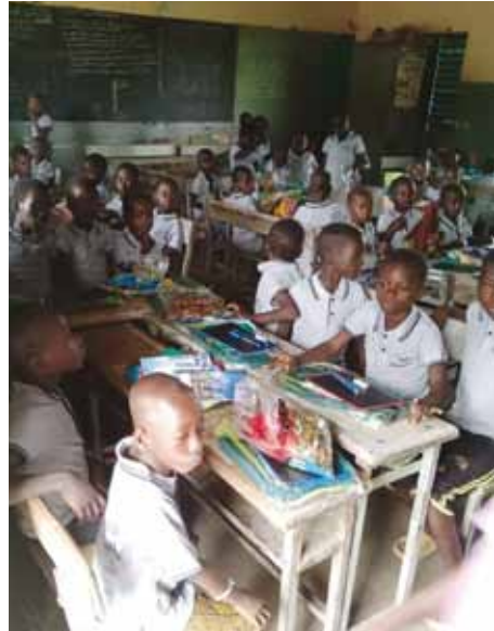
La 1ª elementare del villaggio Demapouin.

In questo anno 2025, per merito del Distretto 108 Yb, con il sostegno anche dei Distretti 108 Ya e 108 La, saranno due i villaggi che, con il coordinamento organizzativo dei collaboratori di MK Onlus, riceveranno la costruzione dei locali cucina, l'acqua potabile per la scuola e per le famiglie, visite oculistiche con donazione degli occhiali, orto didattico e cooperativo. Si tratta di