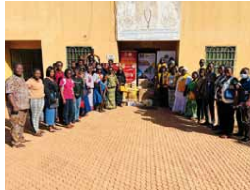
Consegna di viveri all'orfanotrofo Home Kisito.

Un contributo è stato donato ai CREN (Centri di Recupero ed Educazione Nutrizionale) CMAMK di Sabou, Sacré Cœur di Boussé e Bonyolo di Reo; MK sin dall'inizio sostiene e cerca di combattere il problema degli orfani e della denutrizione e malnutrizione.