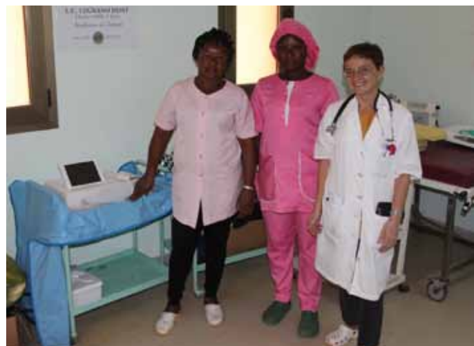
Ecografo fetale donato all'Ospedale di Sabou.

All'ospedale rurale di Sabou è stato donato un ecografo fetale finanziato dal Club Legnano Host del Distretto IB1. Questo Distretto da oltre 7 anni sostiene i progetti sanitari e umanitari di MK Onlus.