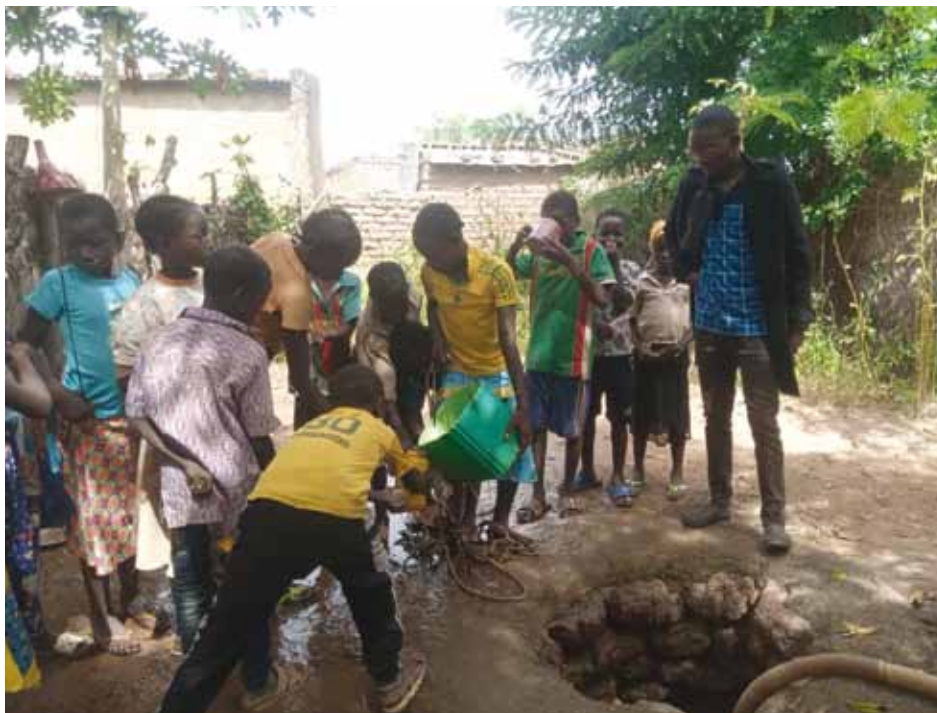
L'attuale pozzo del villaggio Villy.