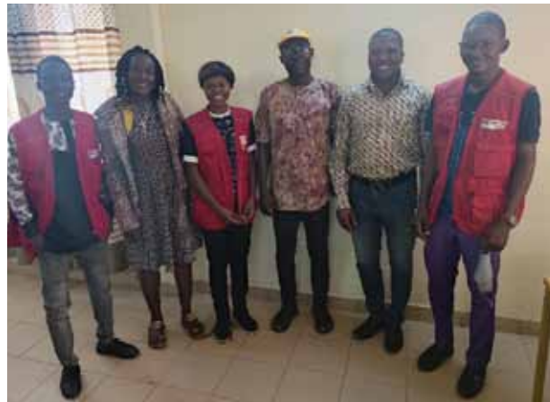
Equipe de ASDE au BURKINA.