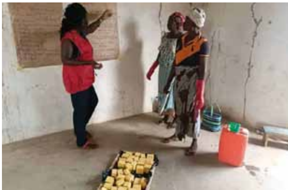
Une vue d'image d'un essai des femmes après une formation.

cette initiative et pour leur assistance.