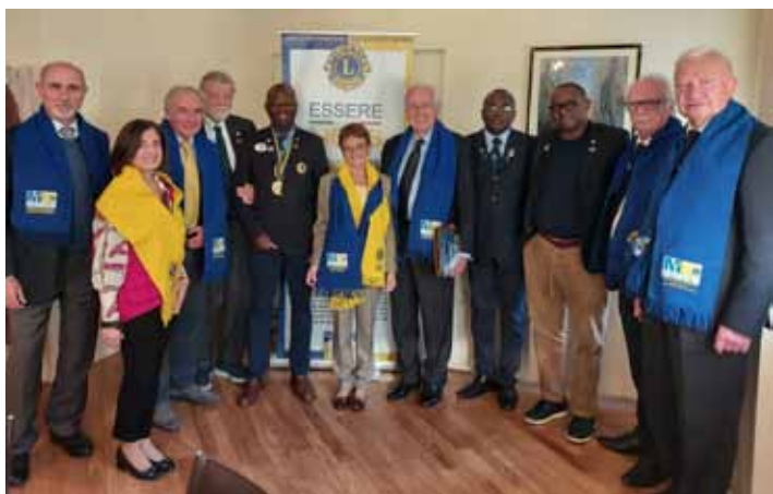
Il gruppo MK con il Governatore del Burkina ed i suoi collaboratori.

Questo progetto, che è in sintonia con il programma "Vivi il tuo paese", si inserisce in una più ampia opera