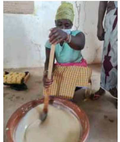
Une vue d'image de l'étape du mélange du savon de lessive.

La planificatrice de l'association ASDE et les bénéficiaires de la formation se réjouissent pour