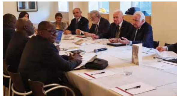
Al tavolo di lavoro.