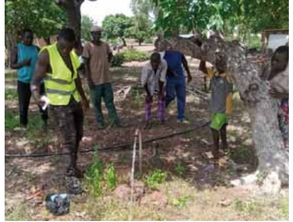
Image de la réhabilitation du forage de Lallé Yactenga.