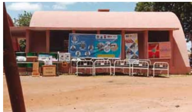
Inaugurazione della rinnovata maternità di Leo.