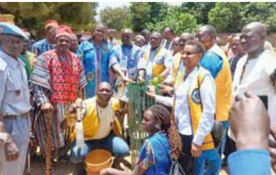
Une d'image aux matériels aux bénéficiaires de Leo.

Une vue d'image de la collecte de données dans la maternité de Pella.