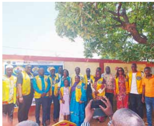
Une d'image de photo de famille de la remise officielle de kits.