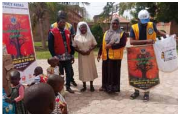
Consegna di viveri all'orfanotrofo Les Saints Innocents.