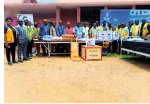
Une photo de famille de la remise des matériels.

La maternité de Leo dans la province de la Sissili, région du centre-Ouest et chef-lieu Leo a été dotée en matériels médicotecniques le 05 Août 2024. La remise des matériels a été procédé par les Lions du Burkina avec l'équipe technique ASDE . Cette activité est logée dans le projet « maternité sûre ». La valeur de ces matériels s'élève à millions de CFA. En effet, ces matériels sont indispensablement composés de tables d'examen et d'accouchement, des lits d'hospitalisation équipés de matelas mousse spéciale, de boîtes d'accouchement, des tensiomètres électriques, des stéthoscopes double tubulure, d'aspirateurs à pédale, de doppler foetales, lampe frontale, pèse-bébé électrique, escabeau à deux niveaux, lunettes, potence etc. Ce matériel permet