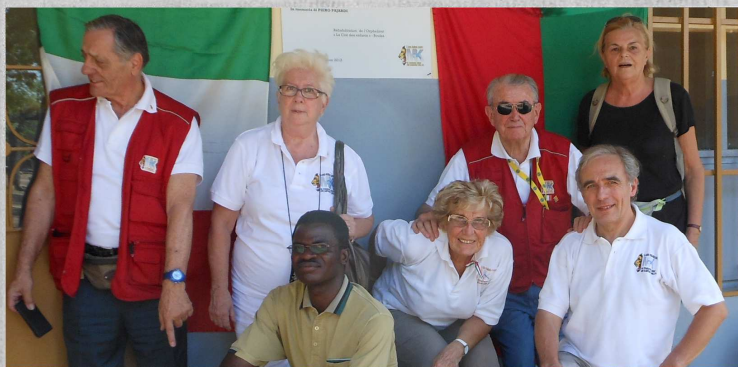
Ici, les membres de l'association ont posé en famille à côté de l'orphelinat la « Cité des enfants » de Bousé qu'ils venaient d'inaugurer

aussi sur tous les clubs lions du Burkina Faso », a-t-elle expliqué avant d'ajouter : « Nous avons tenu une assemblée générale la dernière fois avec les présidents des lions clubs du Burkina pour voir ce qui a pu être réalisé au cours de l'année, et faire des projections pour l'année 2014. En somme, nous sommes satisfaits des résultats atteints. Toute chose qui nous encourage à poursuivre nos actions pour les années à venir ». Et pour l'année 2014, les Italiens prévoient de continuer à appuyer les orphelinats, à faire des forages pour permettre aux habitants, surtout ruraux, d'avoir de l'eau potable, de continuer les campagnes de vaccination et surtout de réaliser un des projets qui leur tient à cœur : celui agricole basé